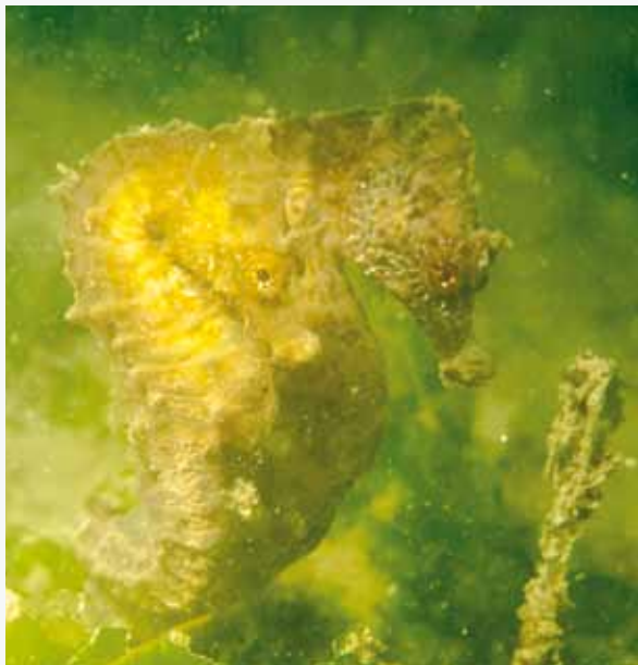
Hippocampe à museau court

Le diagnostic écologique de cette aire marine protégée a été achevé en 2012 pour l'Agence des Aires Marines Protégées et a révélé un bon état écologique des habitats. Lors de cette étude, 179 espèces benthiques ont ainsi été inventoriées parmi lesquelles des espèces d'intérêt commerciales comme la telline, la nasse changeante ou le poulpe. D'ailleurs, la richesse biologique de ces habitats est bien connue des pêcheurs qui y concentrent une partie de leur activité.