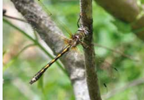
Cordulie à corps fin

Le délicat exercice de la rédaction d'une Charte Natura 2000 restant toutefois perfectible, une amélioration de cette charte pourra intervenir après 2 ou 3 ans de mise en œuvre. Ces modifications pourront également intégrer les changements intervenus sur le territoire (nouvelle Politique Agricole Commune, retours d'expériences de travaux, etc.).