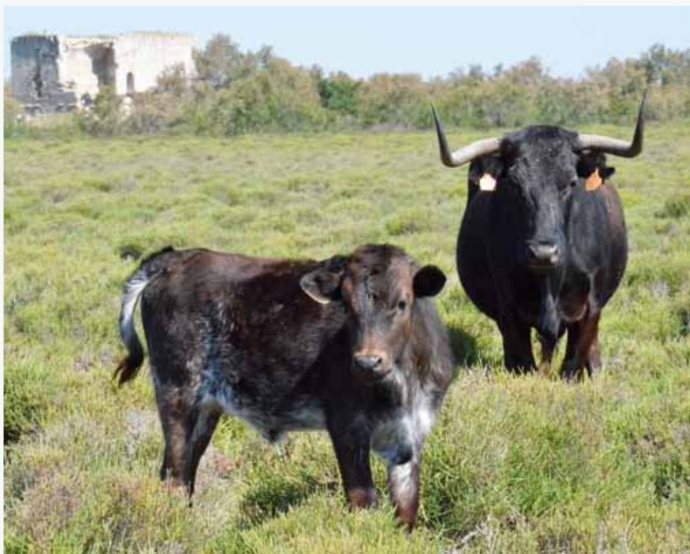
Elevage camarguais