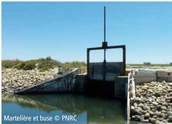
Martelière et buse

En Camargue, sur les étangs et marais des anciens salins de Giraud (propriété du Conservatoire du littoral), les actions portées par le Parc naturel régional de Camargue et la Tour du Valat consistent notamment à réaliser des travaux hydrauliques permettant une alimentation gravitaire en eau de mer des lagunes auparavant alimentées par les pompes des Salins du Midi. La variabilité annuelle et interannuelle des niveaux d'eau constitue l'une des conditions de gestion du site qui se compose d'une grande diversité d'habitats et d'espèces d'intérêt communautaire dont l'unique colonie française de flamants roses sur l'étang du Fangassier.