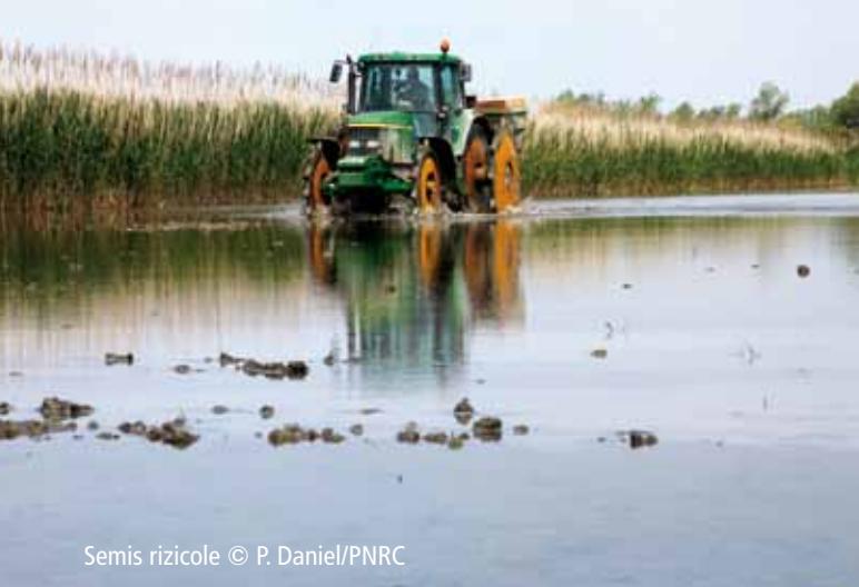
Semis rizicole