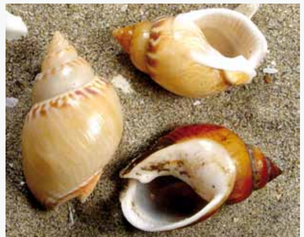
Nasse changeante, une pêche en développement

Par ailleurs, 2 espèces d'intérêt communautaire fréquentent ponctuellement la zone : la tortue caouanne et le grand dauphin. Les tortues marines bénéficient sur la commune du Grau-du-Roi d'un centre de soins pour tortues marines qui intervient suite à des échouages ou captures (CESTMED). Un autre animal emblématique y est observé régulièrement, notamment à proximité des enrochements de la digue de Port Camargue : l'hippocampe à museau court.