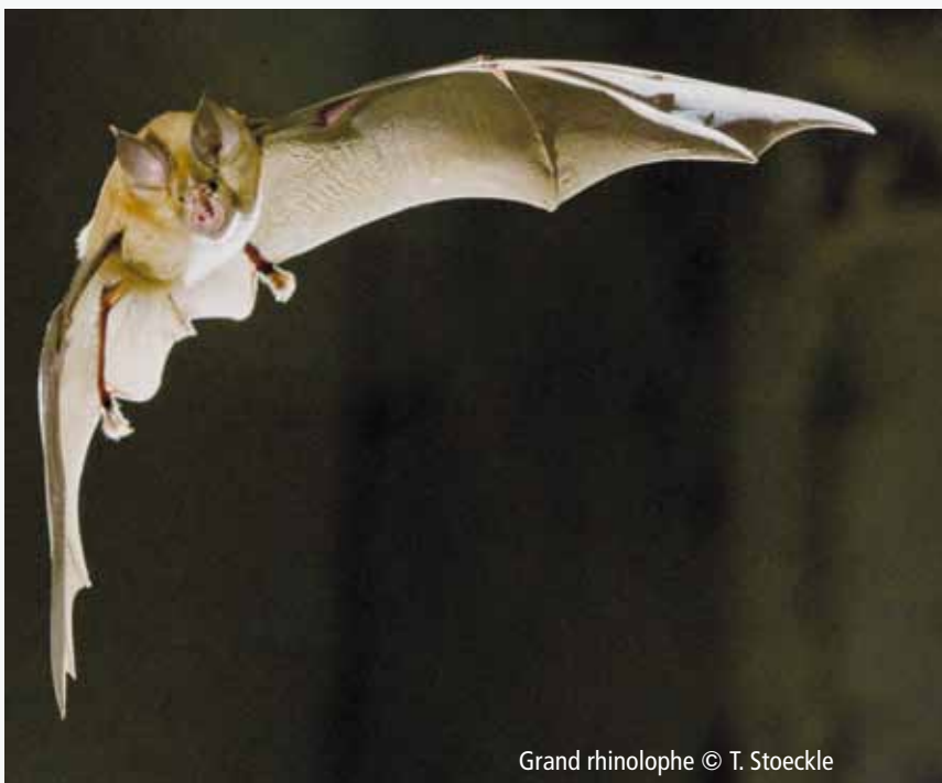
Grand rhinolophe