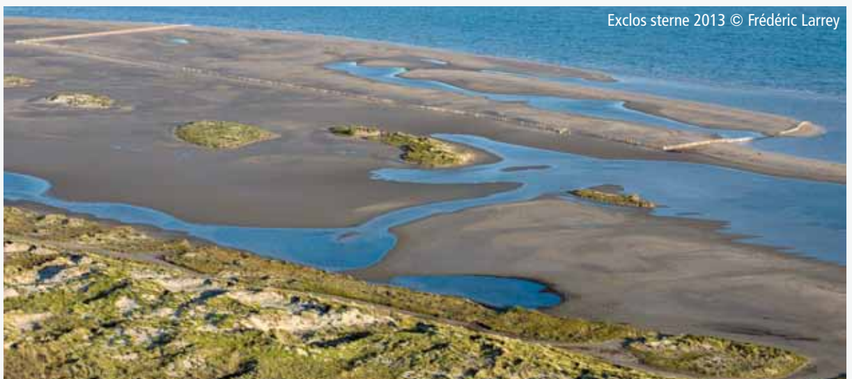
Exclos sterne 2013