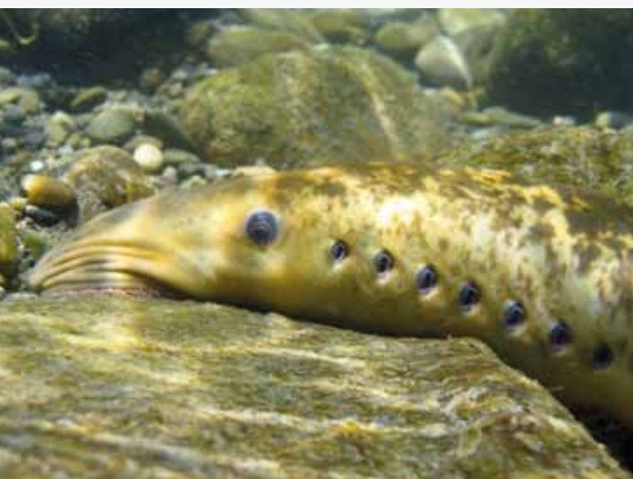
Lamproie marine

Cette démarche a permis également d'homogénéiser les objectifs du site Rhône aval avec ceux du Petit Rhône et permettre ainsi un rapprochement des deux sites pour l'élaboration de leurs documents d'objectifs respectifs. Cette démarche de mutualisation des sites Natura 2000 proposée par les services de l'Etat préfigure l'animation commune des actions NATURA 2000 sur le Rhône à partir de 2014.