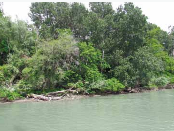
Ripisylve du Rhône

Dix grands objectifs de conservation ont été mis en évidence pour les deux sites : sept objectifs transversaux (qui concernent indirectement les habitats et les espèces) et trois objectifs propres aux espèces et/ou habitats d'intérêt communautaire.