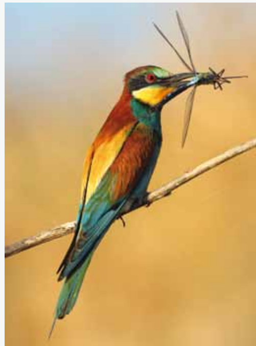
Guépier d'europe