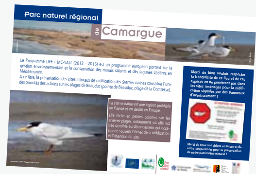
Panneau de sensibilisation sur la nidification des sternes naines sur les plages

Un site internet est dédié à ce programme ( www.mc-salt.eu ) qui rassemble des gestionnaires de sites NATURA 2000 en France (Parc naturel régional de Camargue, Tour du Valat, mais aussi le Groupe Salins sur les salins d'Aigues-Mortes), en Italie et en Bulgarie.